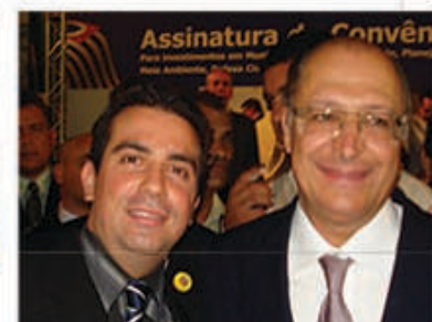
GOVERNADOR GERALDO GERALDO ALCKMIN