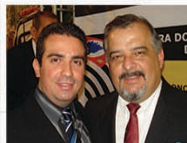
VICE GOVERNADOR MARCIO FRANÇA