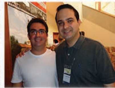
DEPUTADO FEDERAL EVANDRO GUSSI