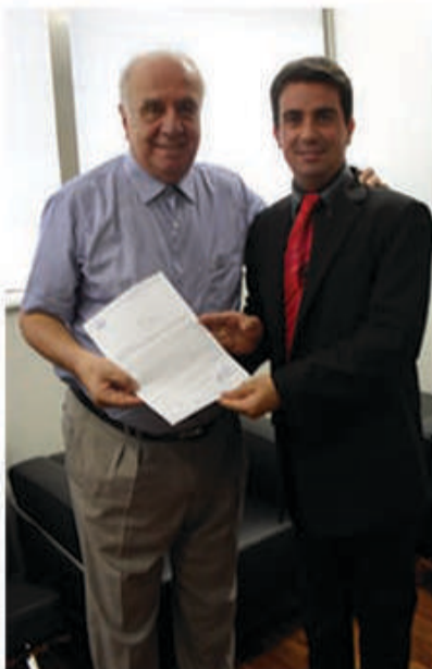
DEPUTADO FEDERAL VÍTOR SAPIENZA