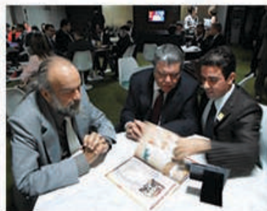
DEPUTADOS FEDERAIS PENNA E SARNEY FILHO

ELEIÇÃO É COISA MUITO SÉRIA; PRECISAMOS TER VEREADOR QUE FALE A NOSSA LÍNGUA, QUE DEFENDA OS INTERESSES DA POPULAÇÃO E ESTEJA SEMPRE DISPOSTO A OUVIR. ASSEGURO QUE REUNO TODAS ESSAS QUALIDADES E TENHO CAPACIDADE E FORÇA PARA NOS REPRESENTAR E ELEVAR O NOME DE MONTE ALTO.